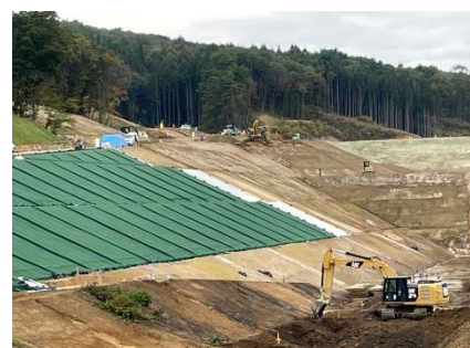
遮水シート設置 (施工中)