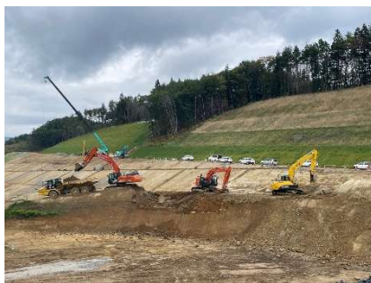
埋立地 掘削・盛土 (施工中)