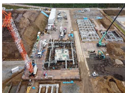
浸出水処理施設 処理棟 (施工中)