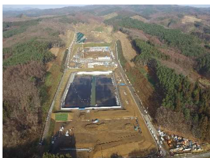
造成状況 (全景) R7. 12. 2 撮影