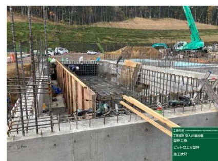
管理棟工事 鉄筋組立 (施工中)