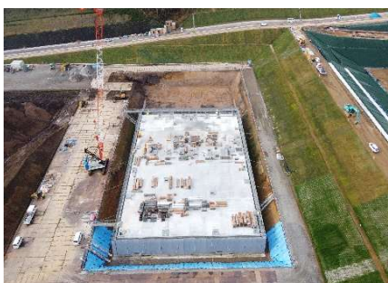
浸出水処理施設 調整槽 (施工中)