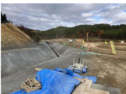
付替河川上流部 (完成直前の様子)